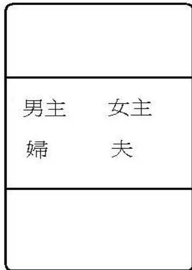
圖(三)主人夫婦駕車