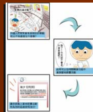
時間轉換使用流程

作品概述：目標對象鎖定在國外自助旅行、半自助旅行、商務旅行、或是跟著觀光團的旅遊者以及長期在國外留學者，各年齡層皆能簡單的使用此加值服務，讓使用者在國外能更加方便。