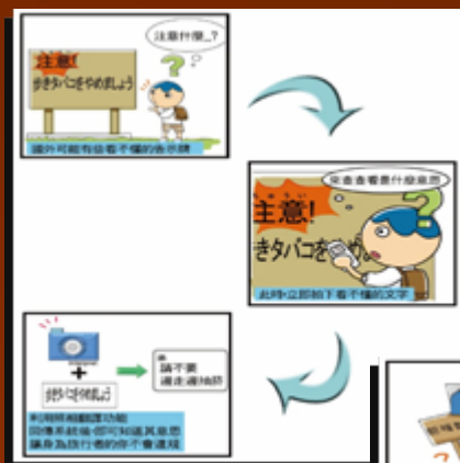
拍照翻譯使用流程