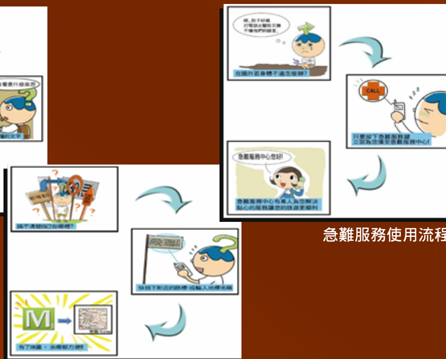
急難服務使用流程