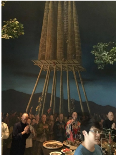
這張就是傳說中的“搶孤”