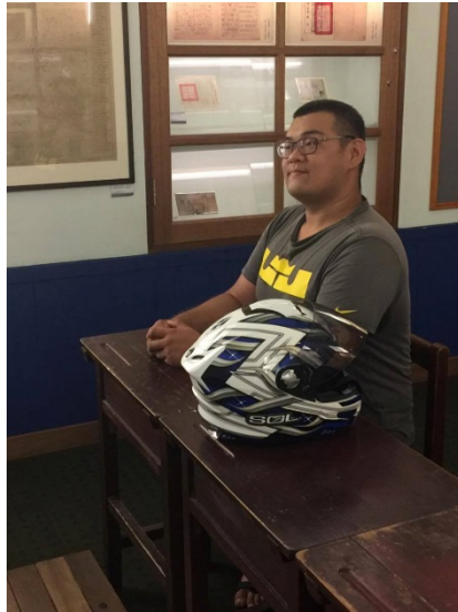
這張是在館內某一間教室裡面的部分，而我正在模仿當時認真的學童的姿勢