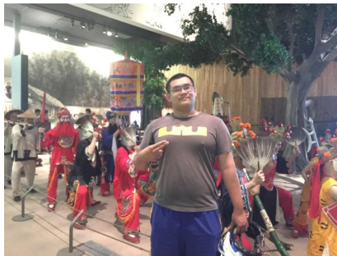
這張是與廟會活動一起合拍的，背後則是八家將。