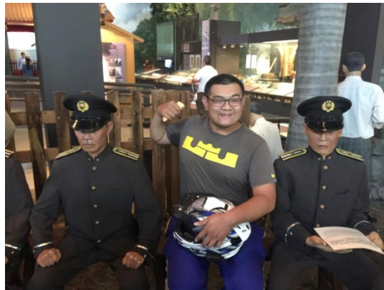
這張則是與日本軍官一起合照，而動作就...哈哈哈哈哈，玩著的心態在拍